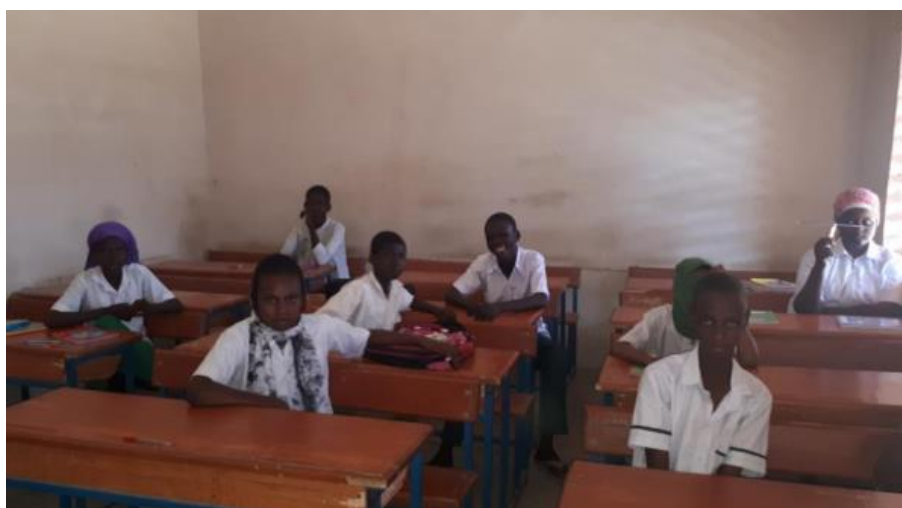
Schüler an der EETS